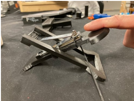
Coupe ongle main gauche pour Aurélie: