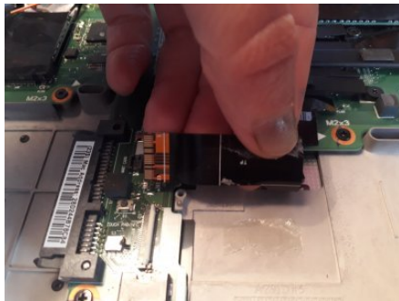
Débrancher le haut-parleur