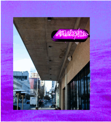
Semaine 2 La société sans contact