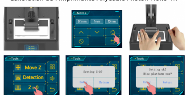
Calibration de l'imprimante Anycubic Photon Mono 4K