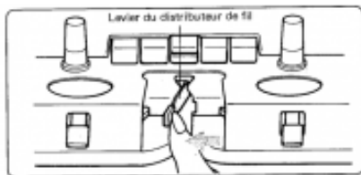
Poussez le levier du distributeur de fil vers la gauche.