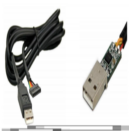
Cable FTDI USB-Série.

Pour fabriquer ce câble, nous nous sommes largement basés sur le tutoriel de Daviworks (lien ci-dessous).